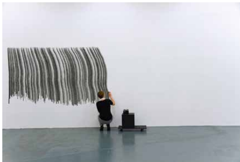
Marianne Mispelaère, mesurer les actes , 2011-en cours, dessin in situ, action performative de dessin, encre de chine sur mur, pinceau petit gris, dimensions variables, Courtesy Marianne Mispelaère, © Photo: Nicolas Lelièvre, © ADAGP, Paris, 2018