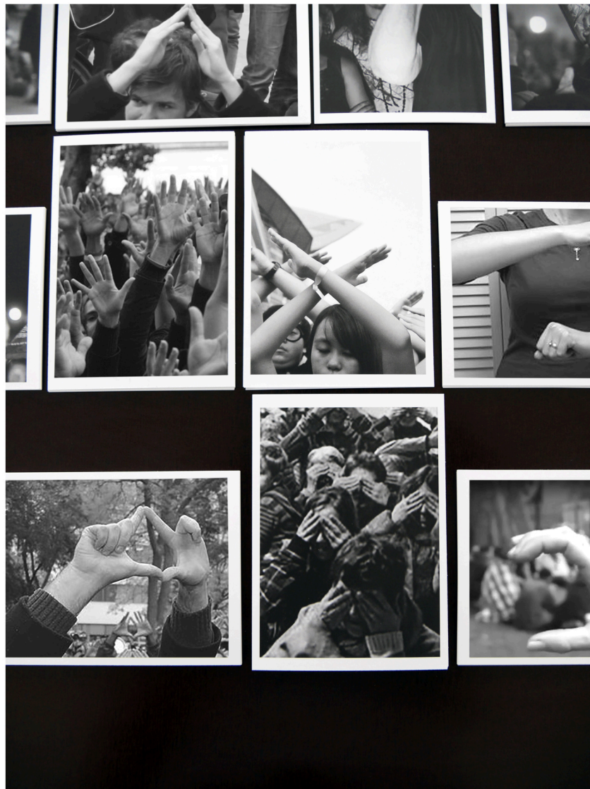
Marianne Mispelaëre, silent slogan , 2016-en cours, cartes postales, série de 32, 700 exemplaires, capture d'écran, texte, impression offset, 10,5 × 14,8 cm, Courtesy Marianne Mispelaëre, © Photo: Marianne Mispelaëre, © Adagp, Paris 2018