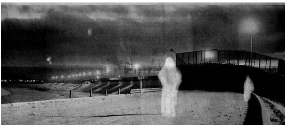
Le poste-frontière de Tijuana au Mexique. Avec ce nouveau système, n'importe quel citoyen américain peut surveiller le désert texan ou les rives du Rio Grande, chez lui, en fixant l'écran de son ordinateur. Guillermo Arriaga