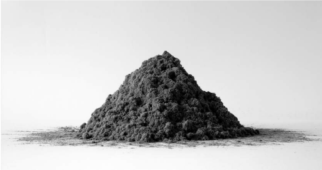
Jérémie Bennequin, Mo(n)t , 2007, poussière de gomme à encre, cendre du temps perdu à effacer la Recherche proustienne. (photographies: Jérémie Bennequin).